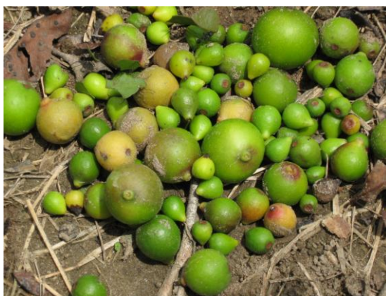
Figura 5. Frutos caídos sanos y con plagas

Para minimizar la caída de frutos se recomienda: