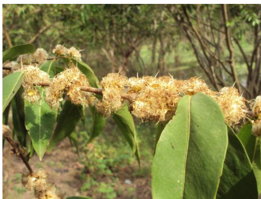
Figura 33. Floracion del camu-camu en Yarina Cocha

- El picudo del fruto ( Conotrachelus dubiae ) y el chinche Edessa pueden ocasionar caída de fruta que podrían llegar a niveles altos. 2