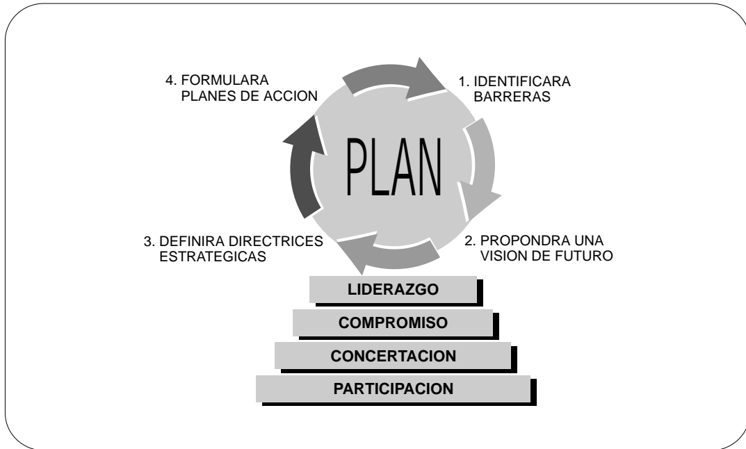
Figura 1. Liderazgo, compromiso, concertación y participación son asuntos claves en la puesta en marcha del “Plan estratégico de desarrollo turístico en la carretera Iquitos - Nauta: atractivos turísticos y lineamientos de uso”. Elaborado por el equipo del proyecto.