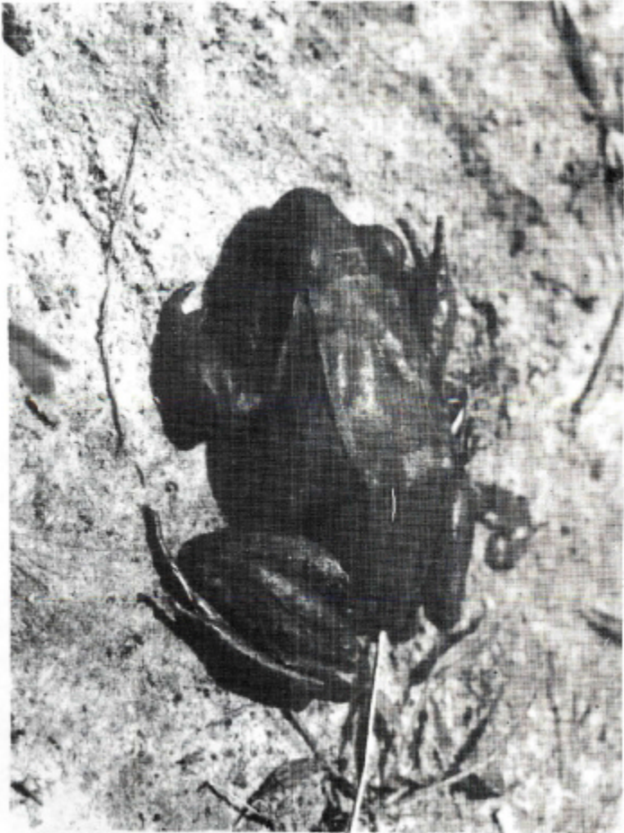
ESPECIMEN ADULTO DE Leptodactylus pentadactylus . (Amphibia:Leptodactylidae).