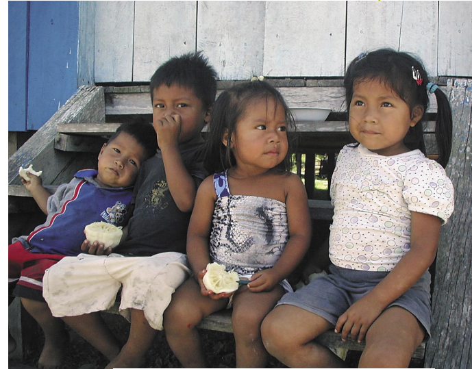
Los niños son la principal motivación para el esfuerzo de manejo que hoy realizan los pobladores del Nanay.