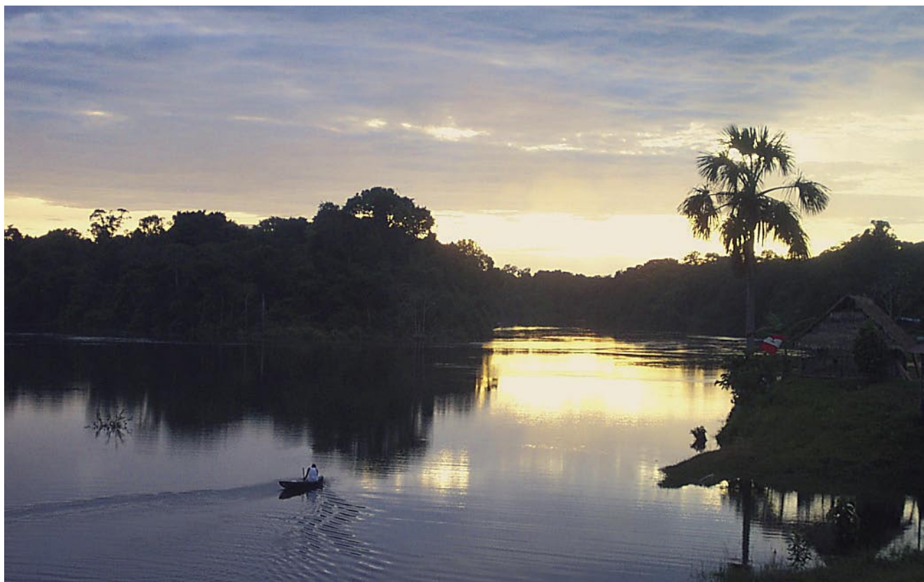
Las cochas de Nanay son pequeñas y poco productivas debido a la pobreza de nutrientes de sus aguas.

La cuenca del Nanay también posee escaso caudal, de apenas cien metros cúbicos por segundo como promedio, que disminuye en verano. Además, su cauce es estrecho: tiene no más de cien metros de ancho en la cuenca baja y entre cuarenta a sesenta metros en la parte alta. Por lo tanto, es un río vulnerable ante cualquier intervención humana.