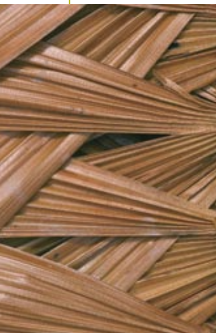
El irapay, símbolo de riqueza en el Nanay.

Esta actividad vital para las comunidades nativas y campesinas del Nanay, se realizará, de acuerdo con el plan, bajo reglas y medidas muy rigurosas de control, fiscalización y manejo aplicados y vigilados por la Asamblea Comunal, debido a los problemas de escasez creciente de pescado en la cuenca.