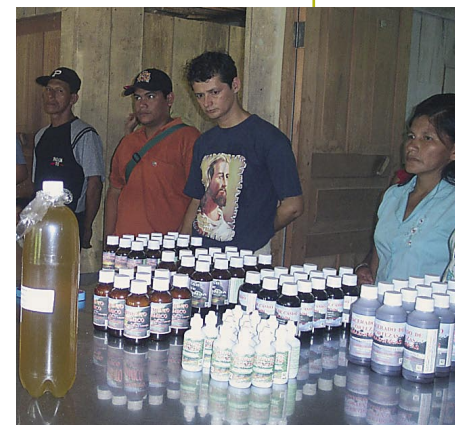
Fitomedicamentos elaborados por Kiní con plantas medicinales.

En la actualidad, cada uno de los grupos de las tres comunidades involucradas en esta actividad se ha especializado en la producción de un tipo de fitomedicamento. Así, en Mishana se producen pomadas de chuchuhuasi, ajo sachá