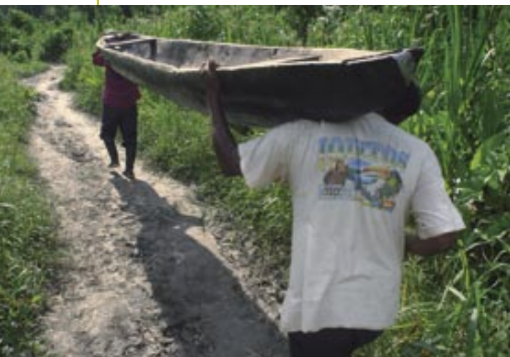
Los pescadores de Lobo Marino hacen turnos para patrullar sus cochas.

Se ha efectuado una zonificación preliminar de las cochas y quebradas de la cuenca del Alto Nanay, de acuerdo al estado de conservación de las poblaciones de peces y a la cercanía de las comunidades que se benefician del recurso con fines de subsistencia. Estos cuerpos de agua son los que existen principalmente en territorios titulados de las comunidades. La legislación vigente les otorga a estas prioridad en el aprovechamiento de los recursos pesqueros.