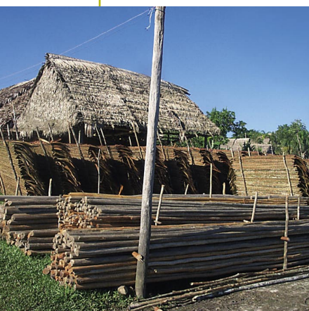
La madera redonda de varillal es un recurso vital para la población del Nanay.

Gran parte de los bosques inundables del curso medio y bajo del Nanay están tan descremados por la tala masiva de árboles frutales para ser vendidos como leña en la ciudad, que se sospecha que esta es