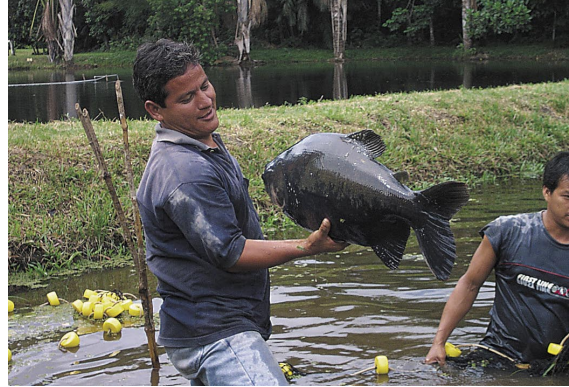
El pescado no es muy abundante en el río Nanay, pero es muy apreciado por su buena calidad