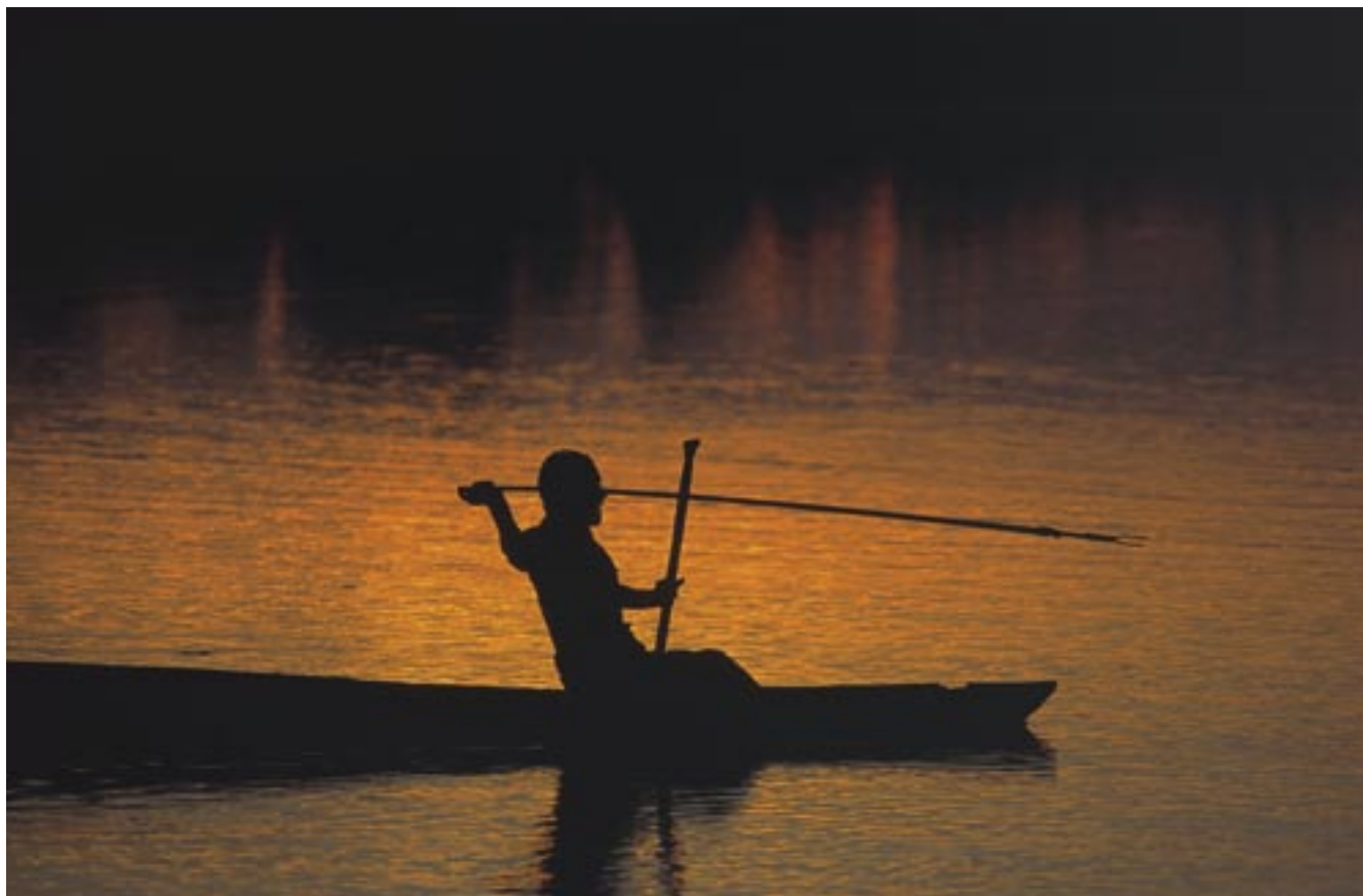
La pesca, tanto para autoconsumo como para fines comerciales, es una de las principales actividades cotidianas de los pobladores del Nanay.

Sobre la base de esta realidad de deterioro creciente de las pesquerías de la cuenca y al amparo de la legislación vigente, la Asociación de Pescadores Artesanales Lobo Marino ha diseñado con el apoyo del Instituto de Investigaciones de la Amazonía