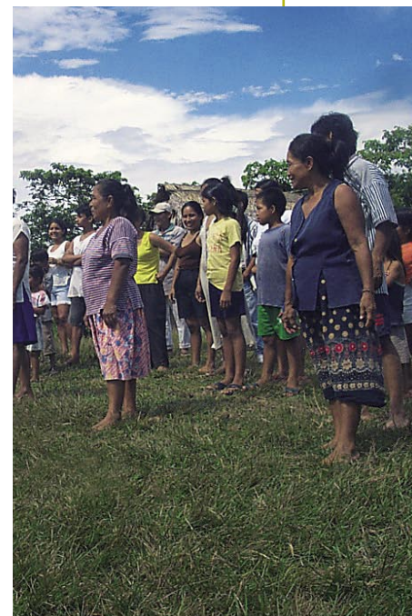
La organización le ha dado a la población del Nanay la fuerza para proteger sus recursos.

En un taller realizado en diciembre de 2003 en Mishana, se analizó la problemática de la zona, se renovó la directiva y se decidió la integración a la organización de seis nuevas comunidades de la margen izquierda del Nanay: Libertad, Shiriara, Yarina, Maravilla, Lagunas y Samito. En junio de 2004, Frecotenama realizó su asamblea anual, en la se discutió sobre la culminación del proceso de titulación de sus territorios.