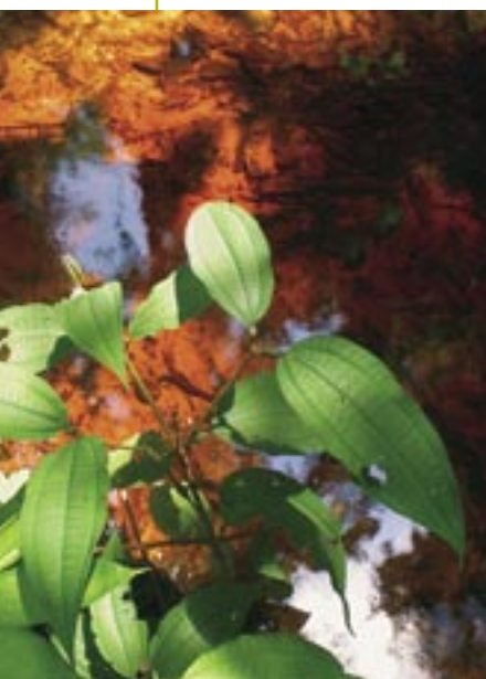
Un bosque y un río sanos son la clave de un futuro mejor para las poblaciones del Nanay.

“Formalización de las actividades extractivas para facilitar el manejo y el acceso a créditos, y evitar abusos de intermediarios” es el objetivo específico número cinco del plan estratégico. Para lograrlo, se plantean estrategias tales como (1) la gestión para la modificación de normas oficiales para la obtención de permisos simplificados (forestales y de pesca) para el aprovechamiento y venta legal de productos con mejores precios; (2) la gestión de permisos forestales de irapay, madera redonda y de aserrío; y (3) la formalización de los pescadores artesanales y de los acuicultores de la cuenca.