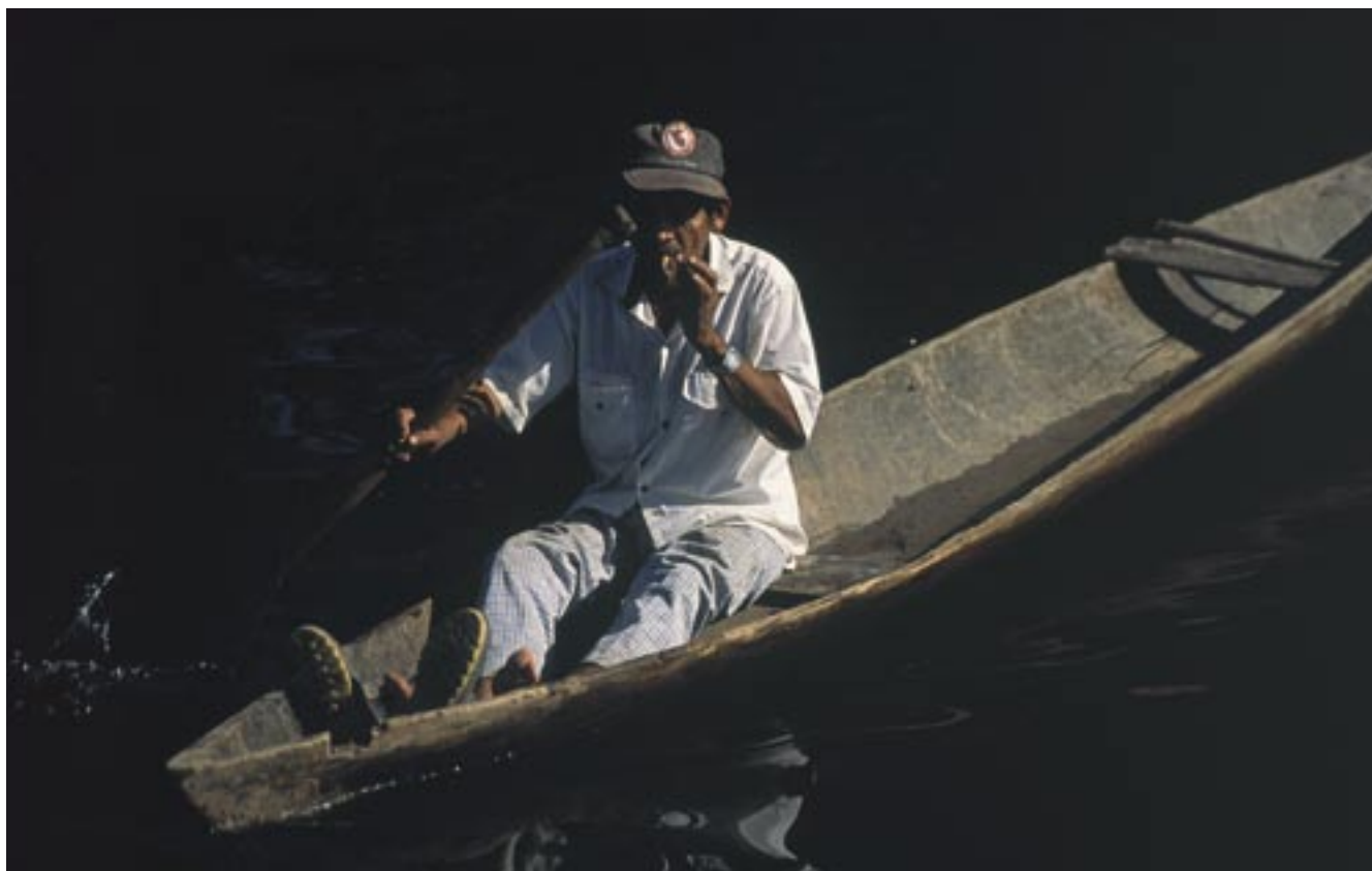
La canoa es un instrumento esencial para el transporte y para la pesca en el Nanay.

El Nanay es un río de poco caudal, sobre todo en verano. Sus cochas, donde se captura el mayor volumen de peces, tienen poca profundidad y son de extensión reducida. Es un río frágil y vulnerable. Por estas y otras condiciones, las pesquerías del Nanay han sufrido severos impactos en los últimos decenios. Las grandes migraciones estacionales de peces, los mijanos, están a punto de desaparecer del Nanay. Algunas pesquerías como las del sábalo de cola roja, yaraquí y zúngaro están al borde de colapso, y especies como el paco, la gamitana y el paiche –cuya exquisita carne les ha acarreado una mayor presión extractiva– han desaparecido hace años en la cuenca del Nanay.