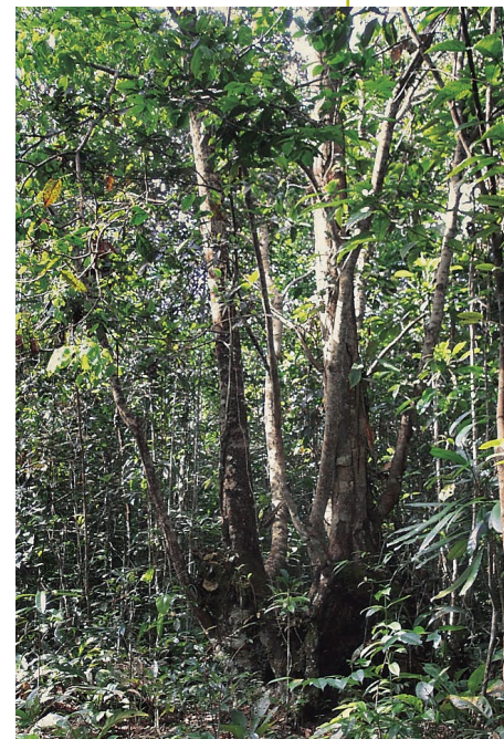
El boa caspi ( Dicymbe uaiparuensis ) es una de las plantas típicas de los varillales.

Las especies predominantes son: parinari, aceite caspi del bajo, quillo sisa, huacapurana, yacu moena, machimango, cacahuillo, quinilla colorada y quinilla blanca. Si bien es cierto que estas especies de árboles maderables tienen algún uso local, aún no tienen cotización en el mercado nacional e internacional. Sin embargo, su conservación es importante como hábitat esencial para la