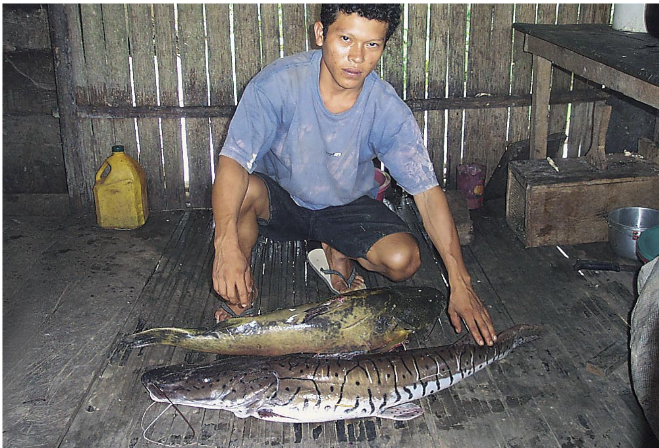
El río Nanay es el único en la Amazonía donde se ha comprobado la reproducción de los grandes bagres o zúngaros.

Poblada por los yameos, omaguas y especialmente los iquitos, sus ocupantes ancestrales, la cuenca vivió en un estado de equilibrio y armonía entre el hombre y la naturaleza a lo largo de la historia. Pero en el siglo XIX cambió bruscamente la historia de la Amazonía con el auge del caucho y el súbito crecimiento de Iquitos, ubicada en la desembocadura del Nanay. Esta ciudad sigue siendo la tragedia y la grandeza de la cuenca del Nanay, donde ahora habitan 25 mil comuneros (sin contar los de la ciudad), algunos de ellos remotos descendientes de los pueblos originales.