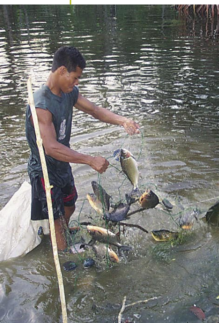
Cosecha de sábalos en piscigranja de Mishana.

Existe un número de especies de alto valor económico actual en el mercado de peces ornamentales, como el pez disco, la raya tigre o el grupo de los Apistogramas, algunos de los cuales alcanzan precios de exportación superiores a los 300 dólares la unidad. El Proyecto apoyó la cría experimental de alguna de estas especies en estanques, aunque los resultados todavía no son concluyentes.