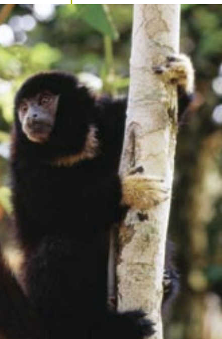
El tocón negro ( callicebus lucifer ) está restringido a la cuenca del Nanay y sus áreas aledañas.

Las dos especies de cetáceos, bufeo negro ( Sotalia fluviatilis ) y bufeo colorado ( Inia geoffrensis ), habitan en el río Nanay y en el Pintoyacu, aunque en número reducidos, debido probablemente a la escasez de peces. Como ha ocurrido en casi