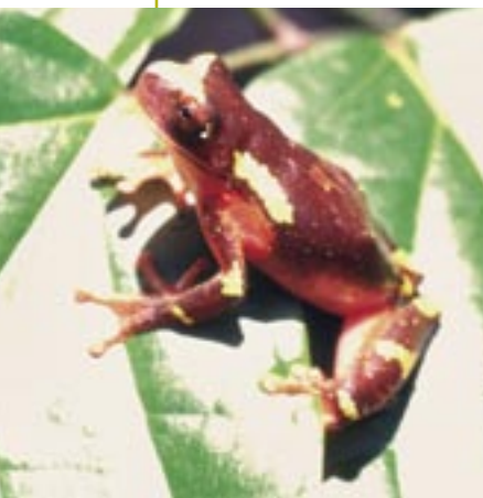
Rana arbórea ( Hyla sarayacuensis ).

Hasta ahora no hay ninguna evidencia cierta de la posible presencia del más grande, emblemático y más famoso de los quelonios amazónicos, la charapa ( Podocnemis expansa ), aunque algunos afirman haber capturado algunos ejemplares en