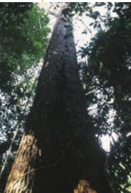
En las tahuampas del Nanay los árboles dependen de los peces para dispersar sus semillas.

No obstante estos logros, todavía persisten en la cuenca del Nanay formas no sostenibles de pesca, practicadas incluso por los propios comuneros. Una de estas es la pesca con barbasco, aunque se ha reducido drásticamente desde el inicio del Proyecto gracias a los acuerdos comunales que prohíben esta práctica. Otra es la costumbre de cerrar los caños de las cochas con redes, y también la práctica de palear o golpear a las palizadas (árboles caídos de las orillas de las cochas que son el refugio de la mayoría de los peces), para obligar a entrar a los peces en las redes, práctica que no es selectiva y altera la bioecología de la cocha y altera la fauna acuática. El Proyecto Nanay ha incentivado a las comunidades a que tomen acuerdos comunales para regular y prohibir estos métodos inadecuados de pesca.