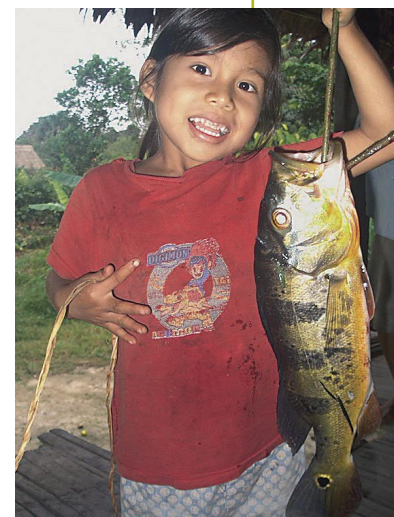
La pesca se está recuperando en el Nanay gracias al manejo.

Está prohibido el uso de redes honderas y arrastradoras en todos los cuerpos de agua. Estas no son selectivas, generan estrés en los peces y provocan la muerte de los individuos pequeños. De este modo se podrá iniciar la recuperación de las especies amenazadas y de las que serán sembradas por el IIAP un plan de repoblamiento.