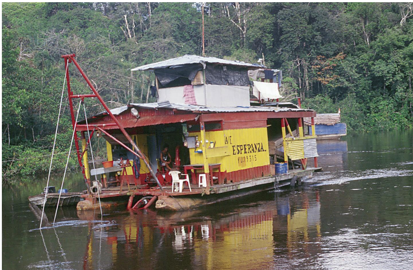
Las dragas para la extracción de oro provocaron una auténtica catástrofe ecológica y social en el río Nanay.

Un primer balance de este monitoreo, realizado en julio de 2004, conduce a una primera conclusión: las amenazas más graves contra la biodiversidad en la cuenca del Nanay han sido mitigadas significativamente en unos casos y, en otros, han desaparecido. Estas amenazas, identificadas en evaluaciones participativas con los comuneros, fueron las siguientes: (1) la extracción aurífera con dragas que estaba contaminando gravemente el río Nanay; (2) la tala y extracción masiva de madera de aserrío por extractores madereros foráneos, en su mayoría ilegales, que usaban a veces maquinaria pesada, con enorme