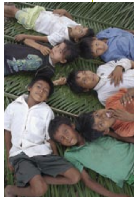
Los niños del Nanay tienen un futuro más prometedor gracias al manejo de los recursos

La organización interna de las comunidades era muy frágil o inexistente al inicio del Proyecto. Tampoco existían normas internas para el usufructo sostenible de los recursos silvestres. Esas normas y reglamentos, elaborados por las comunidades con el asesoramiento del Proyecto, regulan las actividades de pesca, caza y aprovechamiento forestal tanto de recursos maderables como no maderables. Si embargo, falta ampliar espacios de participación de las mujeres en las comunidades, especialmente en los liderazgos comunales.