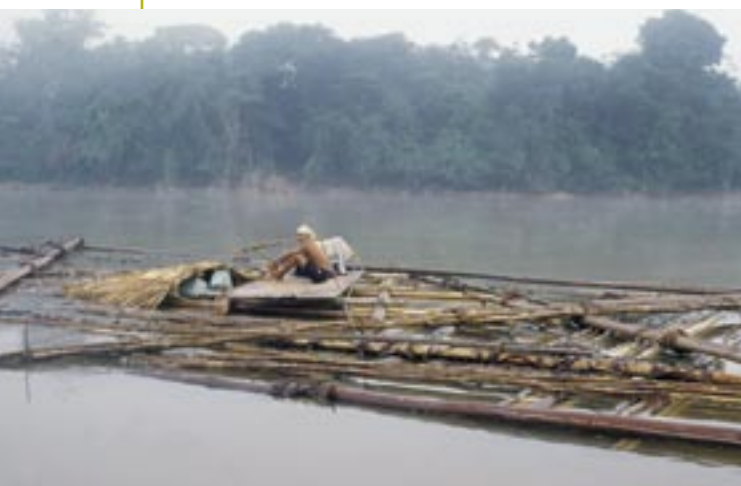
Hoy en día, los bosques de la cuenca del Nanay solo pueden ser aprovechados por los mismos pobladores locales.

Sin embargo, el tener un permiso de extracción de madera (los que solían y suelen ser monopolio de patrones y habilitadores) no garantiza que una comunidad deje de caer en la trampa de la habilitación: algunas personas en comunidades a las que el Proyecto apoyó en la obtención de un permiso forestal siguieron la práctica tradicional, quizás por costumbre o tal vez por la comodidad de vender su madera en el lugar, y recibir el pago por adelantado, aunque este fuese una fracción irrisoria del valor total del producto.