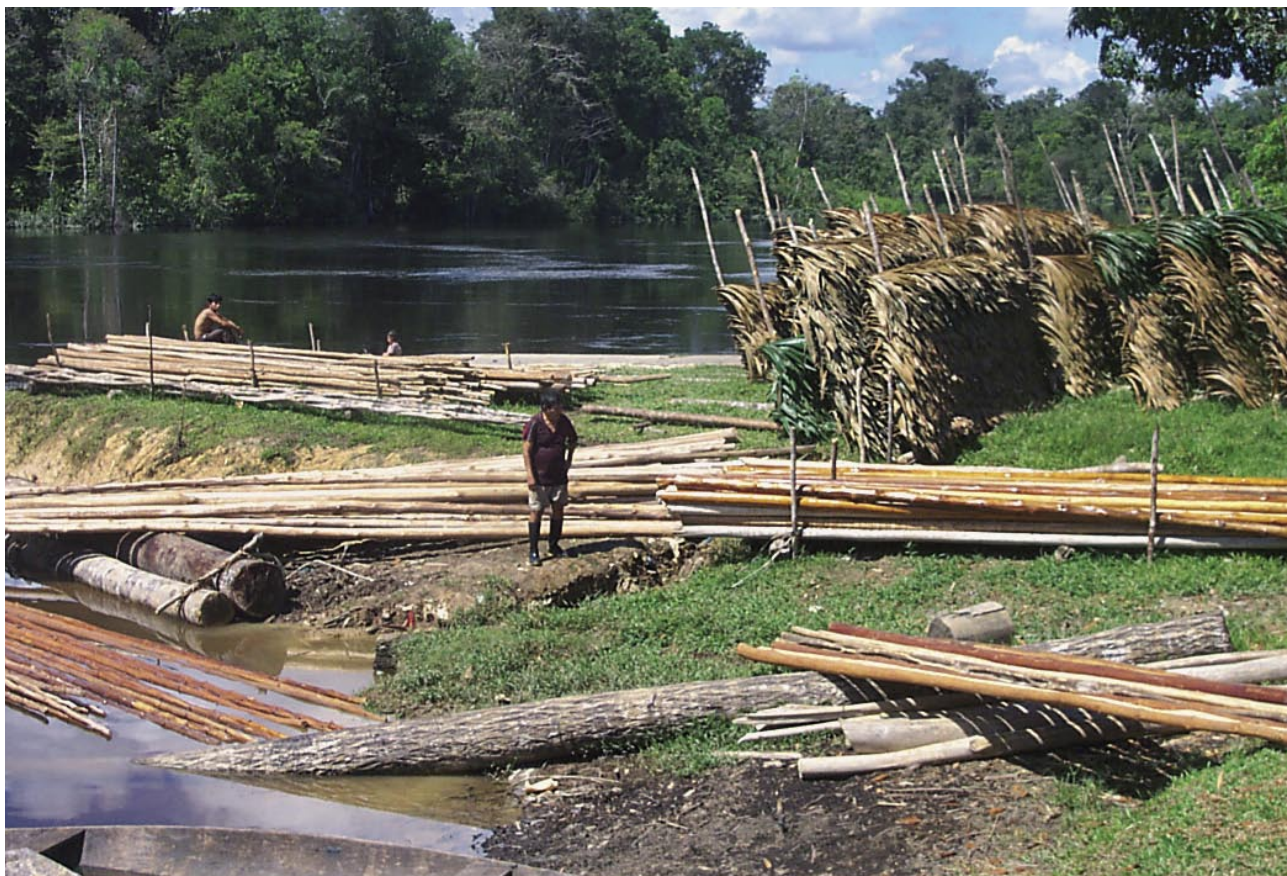
La provisión sostenible de madera redonda y de irapay es una de las máximas aspiraciones de las poblaciones del Nanay.

Como corresponde a un plan estratégico, los comuneros tienen una misión que cumplir. Esta misión es la siguiente: “Trabajar de forma organizada (dentro de comunidades), mancomunada (entre comunidades) y concertada (comunidades, autoridades regionales y municipales, instituciones y ONGs) para mejorar las fuentes de ingreso y la calidad de vida de la población, sobre la base del aprovechamiento sostenible de nuestros recursos gracias al uso de técnicas adecuadas de manejo, la transformación e industrialización de los mismos en la cuenca del Nanay, y la comercialización ventajosa de nuestros productos”.