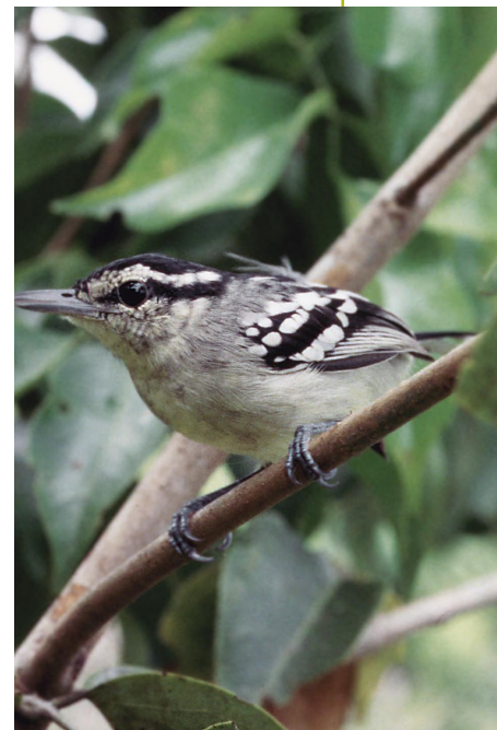
Hormiguerito antiguo ( Herpsilochmus gentryi ), descrito en 1998.

El bosque inundable por el río Nanay es, posiblemente, el único ecosistema en la Amazonía peruana representativo de lo que en el Brasil se llama el bosque de igapó o bosque inundable por aguas negras. Este bosque inundable, o tahuampa en la nomenclatura popular amazónica, drena sedimentos muy antiguos de la era Terciaria y alberga familias