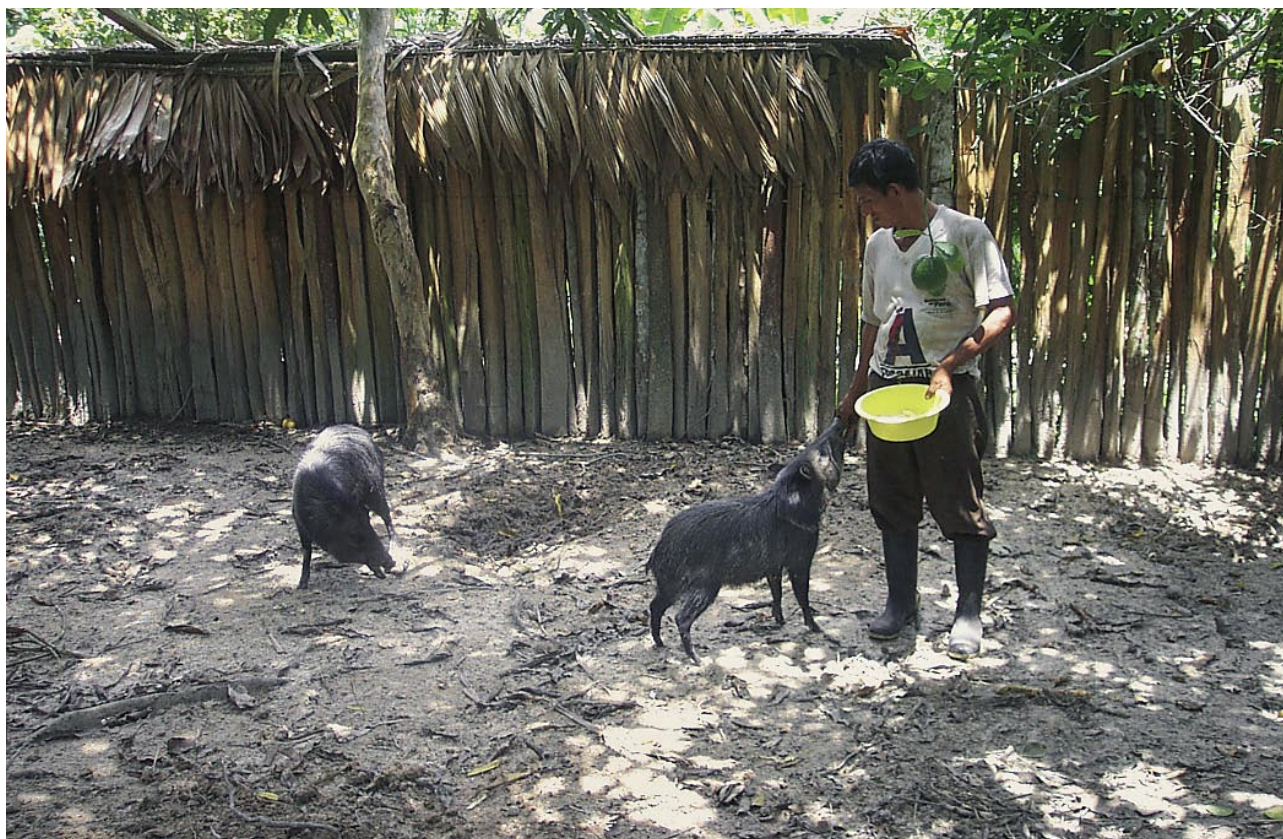
El sajino es un animal de fácil crianza y tanto su carne como su cuero son de óptima calidad.

Frente a la sobreexplotación que ha sufrido el sajino en la cuenca baja del Nanay, y considerando su valor y potencial, algunas comunidades asentadas en el ámbito de la Reserva Allpahuayo-Mishana iniciaron la crianza familiar de esta especie,