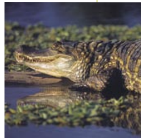
Los caimanes fueron muy abundantes en el Nanay en siglos pasados.

Los inventarios y evaluaciones efectuados por el Proyecto Nanay entre 2003 y 2004 han constatado la existencia de 149 especies de mamíferos. Entre ellas están registrados los marsupiales (17 especies), edentados (9), murciélagos (63), primates (13), carnívoros (13), cetáceos (2), ungulados (5) y roedores (27).