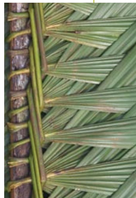
Crisneja tejida con hojas de irapay.

El Proyecto Nanay ha tratado de recuperar algunas de estas prácticas apoyando a las comunidades en el diseño y aplicación de planes de manejo que llamamos “adaptativos”, pues comienzan con medidas muy sencillas propuestas por los pobladores asistidos por técnicos, y van siendo modificadas y mejoradas con el tiempo de acuerdo con las lecciones aprendidas y a la respuesta de cada recurso a las prácticas de aprovechamiento.