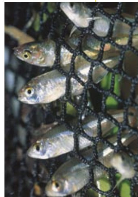
El mercurio utilizado en las operaciones auríferas termina acumulándose en los peces.

De acuerdo con el resultado del monitoreo comunitario, la tasa porcentual de disminución de amenazas provenientes de madereros ilegales en la cuenca del Nanay, a julio de 2004 ha sido del 89%.