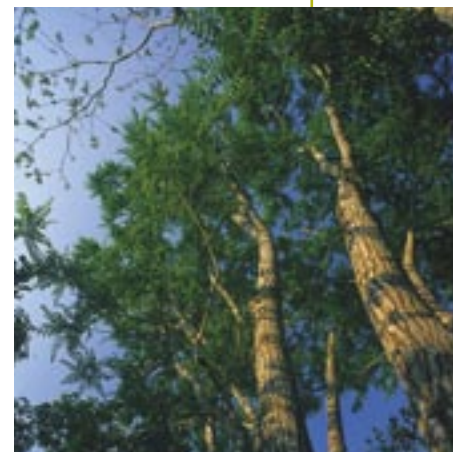
La tala ilegal ha disminuido en el Nanay en más de 90% gracias al control comunal.

No obstante este logro, una nueva versión del mapa aún consideraba ocho concesiones para salir a concurso en la cuenca del Nanay, con un total de setenta mil hectáreas en territorios sobre los que las comunidades estaban tramitando su titulación. Las comunidades afectadas iniciaron nuevamente gestiones a través de memoriales y otros instrumentos legales ante el gobierno Regional, el INRENA y la Comisión Ad Hoc, contando siempre con el apoyo del Proyecto Nanay. Finalmente, las ocho concesiones fueron también anuladas.