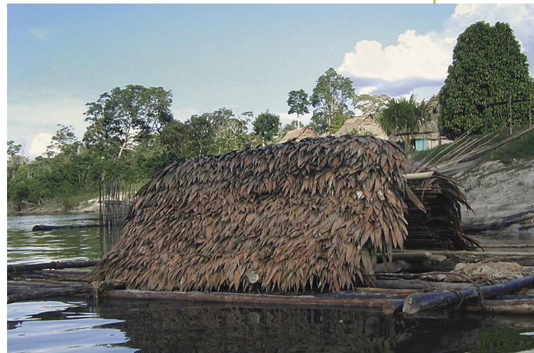
Balsa de irapay camino de Iquitos.

Los comuneros también recibieron capacitación en técnicas y fórmulas de cubicación. Se les informó –mediante ejemplos– sobre el dinero que pierden a través del habilitador y del intermediario cuando estos, al momento en que cubican la madera, utilizan la fórmula Doyle. Ahora saben que empleando la fórmula oficial de cubicación de su madera, están más seguros de no ser engañados.