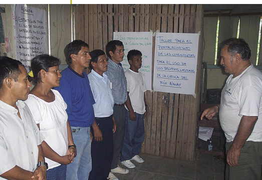
Juramentación de la directiva de la Coordinadora de comunidades del Nanay.

En estos talleres, también se capacitó a la población en general y se trabajó en la formación de los participantes con ayuda del personal técnico del Proyecto, de la Defensoría del Pueblo, del Ministerio de la Producción y de la Capitanía de Puertos, entre otras instituciones del Estado. Los talleres de formación han estado orientados al fortalecimiento institucional y la capacitación para la formulación y aplicación de planes de manejo adaptativo y, en general, al manejo y gestión de la riqueza natural de la cuenca.