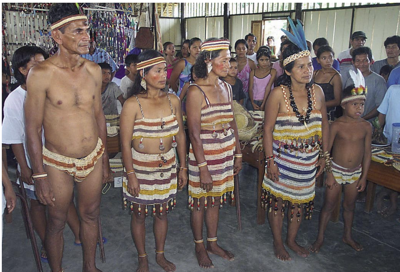
Indígenas Iquito de la comunidad de San Antonio, a orillas del río Pintoyacu.

La gestión local de los recursos de la biodiversidad por parte de las comunidades de la cuenca del Nanay es una experiencia innovadora en la Amazonía peruana, al menos después de la aparición del Estado. La gestión comunal fue la forma en que los pueblos indígenas de la Amazonía manejaron sus recursos durante milenios de forma sostenible. Estos pueblos soberanos fueron despojados por el Estado