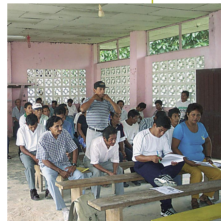
Asociación de pescadores artesanales del Alto Nanay (Comunidad Diamante Azul).

El MAPE también responde a una necesidad socioeconómica de las comunidades nativas y campesinas de la cuenca del Nanay: conservar y manejar las zonas de pesca de la cuenca que han servido desde tiempos inmemoriales como una despensa para la