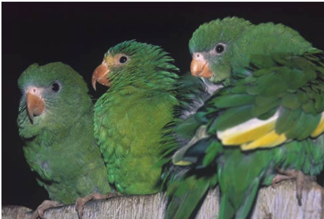
La cuenca del Nanay es extraordinariamente rica en especies de animales, y un importante centro de especiación.

La ciudad de Iquitos no existía y la naturaleza no había sido, por tanto, muy alterada. A raíz de la fundación de esta ciudad, la cuenca ha sido una de las más impactadas en el último siglo y medio. A continuación se transcriben algunos fragmentos de