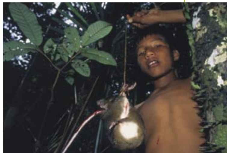
Las futuras generaciones serán las más beneficiadas por la aplicación de la estrategia de desarrollo y conservación de la cuenca del Nanay

El tercer objetivo específico es el siguiente: "Lograr que aprovechemos los recursos de forma racional, sin destruirlos ni quitarles la capacidad para