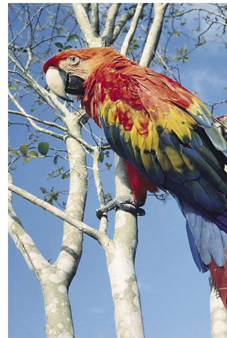
Los animales grandes, como el guacamayo rojo, son muy escasos en Nanay.

La piel o cuero del sajino se comercializa en la Amazonía peruana desde hace varias décadas, y esa ha sido una de las causas de su intensa cacería. Estas pieles son productos de la extracción de áreas naturales sin ningún plan de manejo.