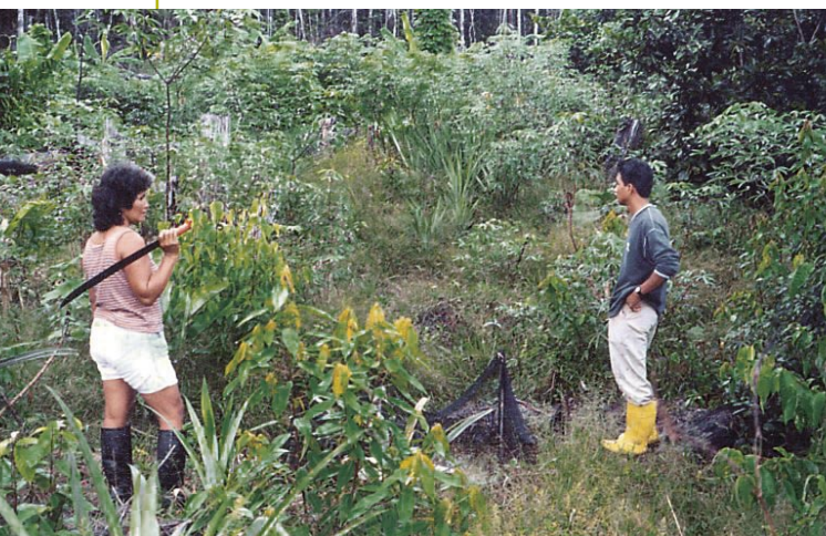
Chacra integral en la comunidad de Mishana.

Con la participación de escolares y padres de familia, se han construido camas almacigueras para la producción de plántones de ungurahui y pona, otra palmera de gran valor económico, utilizada generalmente para