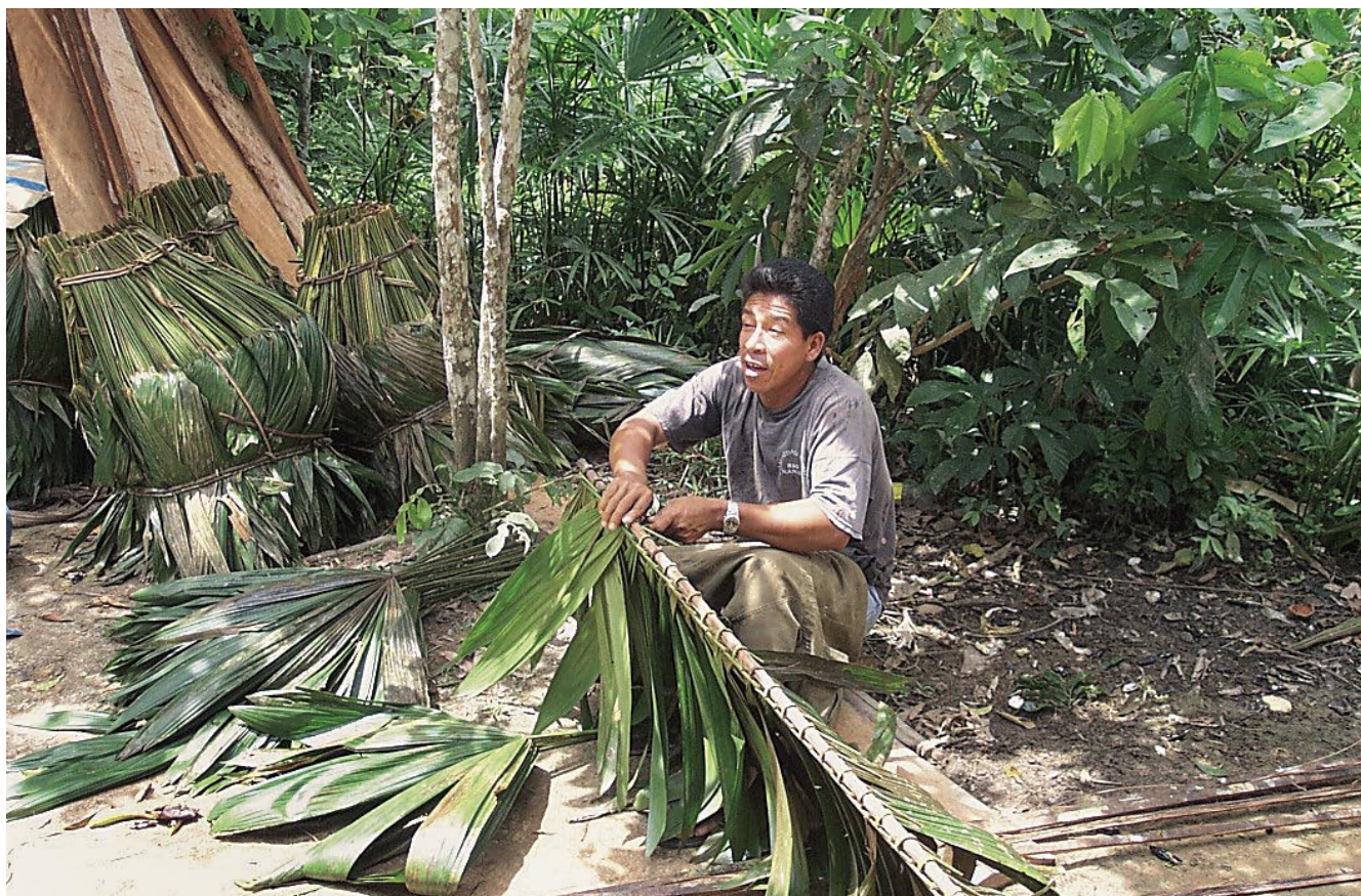
El tejido de la hoja de irapay es la principal actividad económica de la cuenca del Nanay.

Romper este círculo vicioso de pobreza y deterioro de la naturaleza implica poner en marcha un conjunto de estrategias de desarrollo sostenible. Dos de las estrategias empleadas por el Proyecto Nanay del IIAP han sido: (1) el fortalecimiento de las organizaciones