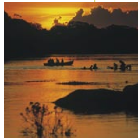
Después de muchos años, los pobladores del Nanay miran con esperanza el futuro.

“Promover el turismo e impulsar la transformación de nuestros recursos naturales con tecnologías a nuestra medida y según la capacidad de nuestros bosques y cochas” es el objetivo específico número cuatro. Para alcanzarlo, las estrategias indicadas son las siguientes: (1) control de las actividades destructivas del potencial industrial y turístico; (2) alianzas estratégicas para el desarrollo de proyectos de transformación y obtención del valor agregado de la riqueza natural; (3) promoción de la investigación y el desarrollo tecnológico con participación comunal; e (4) interrelaciones con organizaciones que contribuyan y ayuden en el acceso a nuevos mercados y la obtención de mejores precios para la producción comunal.