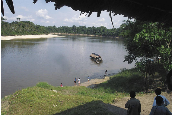
Las aguas negras y ácidas del río Nanay dan origen a un bosque inundable único en Perú similar al igapó de Brasil

Salvar las pesquerías del Nanay es también salvar el bosque inundable de las orillas del río y de las cochas, viveros naturales de la fauna hidrobiológica que es la fuente de alimentos de los pueblos amazónicos, ya que muchas de las especies de peces son los dispersores naturales de las semillas de gran número de plantas. Sin ellos, el bosque inundable está en graves problemas.