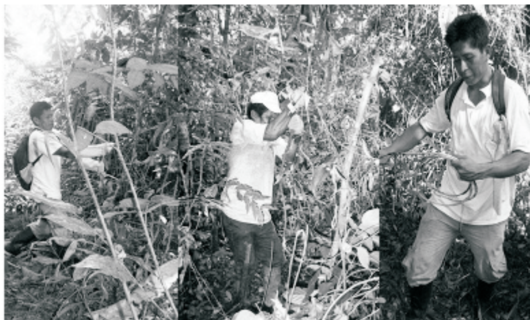
Figura 1. Proceso de extracción de los estípites aprovechables de cashavara Desmoncus polyacanthos sin manejo de los estípites remanentes

Las fibras obtenidas son producto de la cosecha de los estípites maduros y son destinados al mercado local para su utilización en artesanías o cestería. En las ciudades mayores son usadas en la industria de muebles principalmente como complemento de los espaldares y asientos conocidos como “esterillados”. La extracción artesanal consiste en cortar el estípite en la base y jalarlo hasta dejarlo caer al suelo. Luego mediante una clasificación se separa la parte aprovechable (desde la base hasta la parte madura), posteriormente se quita la corteza exterior conjuntamente con las espinas que se encuentran en el estípite (Figura 1). Este proceso de extracción tradicional no tiene en cuenta la clasificación de los estípites presentes en la mata, tampoco alternativas de manejo de los estípites remanentes. En este sentido el presente estudio tuvo como objetivo generar información sobre técnicas de cosecha sostenible para el manejo de cashavara en la Amazonía Peruana y de esta forma contribuir a la conservación de la especie.