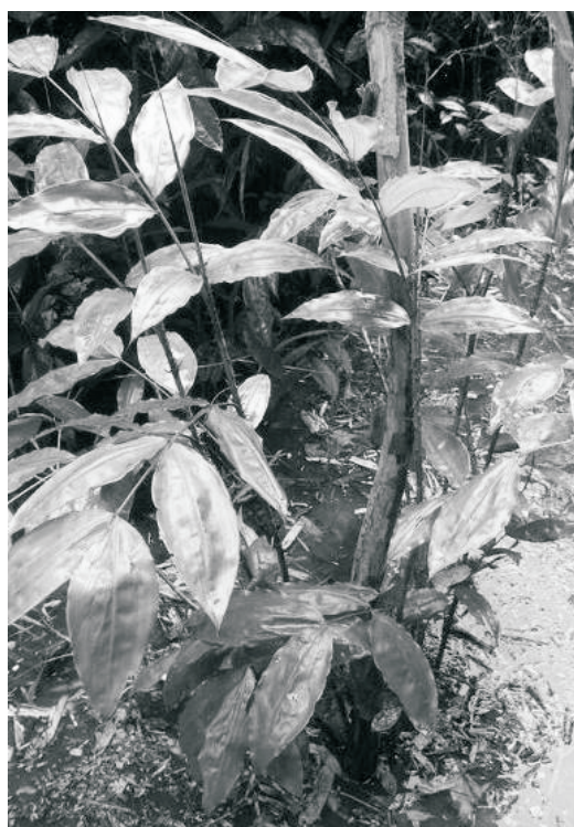
Figura 4. Planta de cashavara Desmoncus polyacanthos con buen vigor.