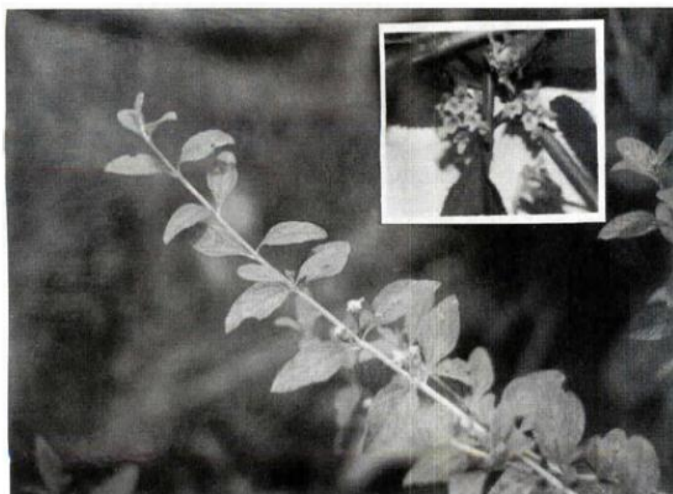
Figura 1. Planta de Lippia alba a la floración.

Rendimiento, se pesó las hojas de cada planta por tratamiento, para la obtención de peso fresco, luego fueron secadas en estufa a 60°C hasta obtener el peso seco, extrapolándose los resultados a kg/ha.