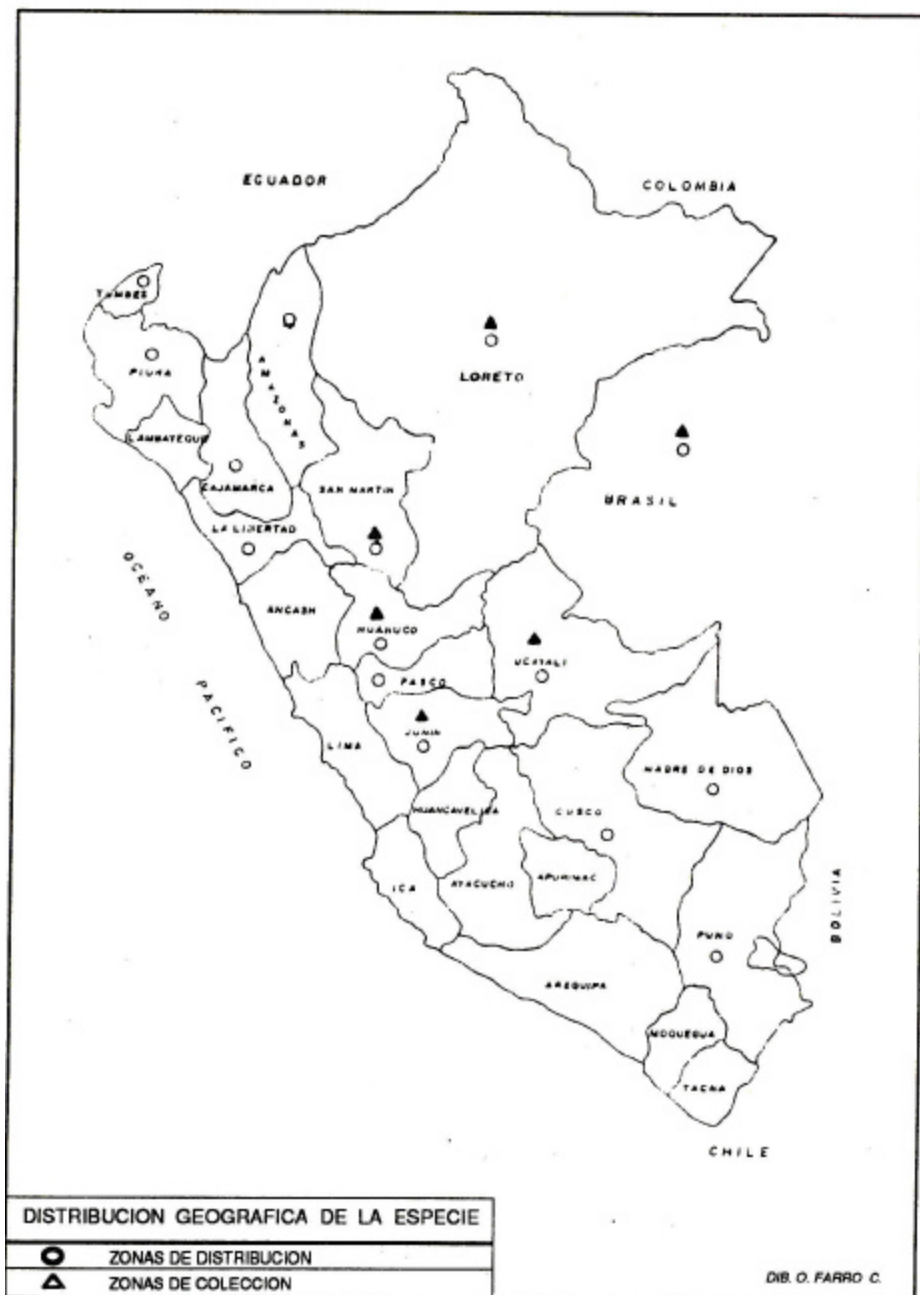
FIG. 2 DISTRIBUCION DE BIXA ORELLANA EN EL PERÚ