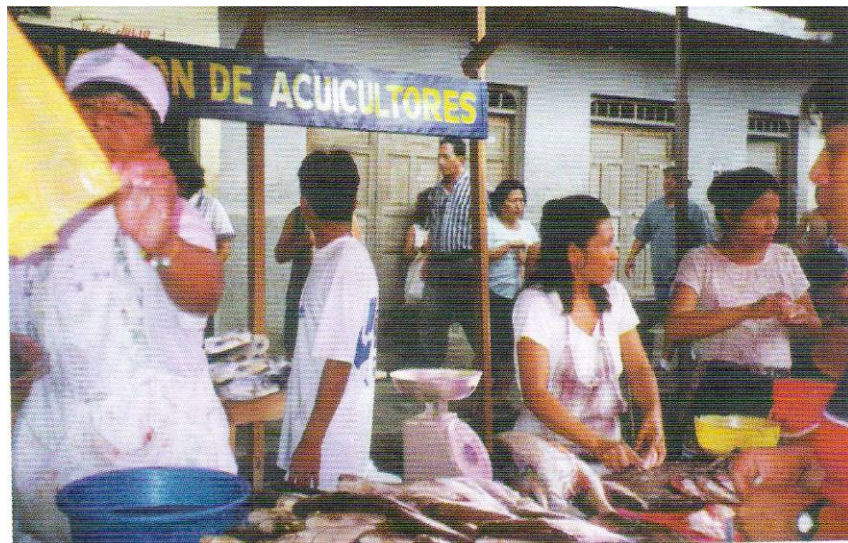
Comercialización del producto

El número de beneficiarios indirectos asciende a más de 5 000 personas, que viven alrededor de los ejes de producción, y a 1 546 estudiantes de colegios agropecuarios de la Carretera Iquitos-Nauta -quienes atendieron cursos de capacitación en Acuicultura.