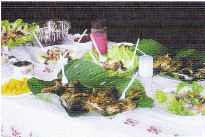
Algunos usos de los productos derivados de la actividad piscícola