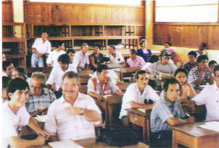
Capacitación de Productores.

En el aspecto técnico, se ha revolucionado el sistema de crianza; la transferencia tecnológica a cargo del Instituto de Investigaciones de la Amazonía Peruana, ha permitido validar la investigación en la práctica. Esta tarea conjunta y retroalimentada entre investigadores y productores, ha permitido constatar que la metodología empleada puede estar al alcance de los productores aun con niveles educativos bajos, quienes pudieron aplicar los conocimientos adquiridos en la conducción de sus estanques y los procedimientos técnicos de monitoreo y seguimiento de sus siembras. Cabe indicar que un rol importante en esta tarea fue realizada por el equipo de extensionistas del Programa, quienes se desplazaban en forma continua a lo largo de las comunidades del área de influencia del Programa, solucionando in situ los problemas o corrigiendo los errores en los que pudiera incurrirse.