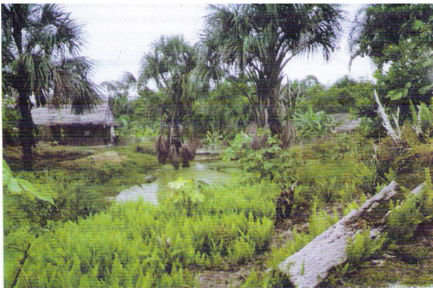
Cochas familiares En abandono

En el área de Iquitos también se están desarrollando cultivos semi intensivos; especialmente de especies propias del eco sistema amazónico, como son la gamitana, el paco y el boquichico. Recientemente se aplicó una encuesta a los piscicultores del área del Napo-Mazán, Tamshiyacu-Tahuayo y Carretera Iquitos-Nauta, observándose que el 87% de productores desea criar peces y, al mismo tiempo, el 80% de los piscicultores considera a la piscicultura como la actividad económica de mayor rentabilidad, en comparación con la agricultura, la ganadería y la extracción de madera (Molnar et al.. 1999).