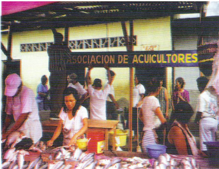
Puesto de venta de la Asociación de Beneficiarios del PROSEAL en el mercado de Belén (Iquitos).

Del total de beneficiarios que recibieron peces en estado de alevino el 100% cosechó la totalidad observándose que, en su mayoría prefieren vender los peces antes que consumirlos.