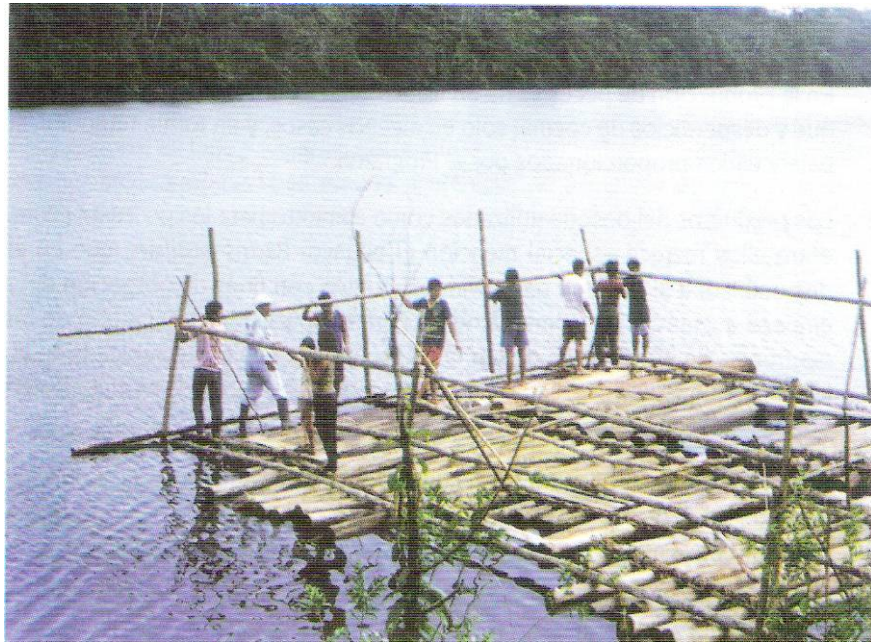
Jaula en construcción en el río Tigre-Comunidad de Huayococha