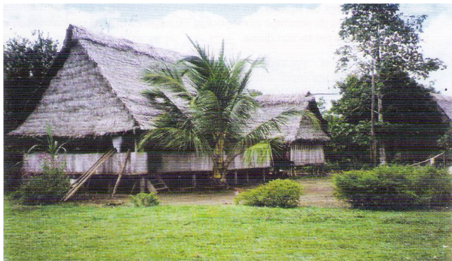
Modelo de vivienda local

La vivienda de la población se caracteriza por ser de material rústico, con paredes de madera redonda o tablas, o pana batida y techo de shapaja; por tanto, es de nivel precario, carente de agua potable y de sistema de desagüe.