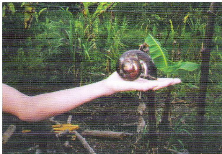
Muestra de churo Pomacea maculata .

De otro lado, debido a las características del ecosistema amazónico, la oferta de pescado en la ciudad está estrechamente vinculada al régimen de creciente y vaciante de los ríos produciéndose una abundancia en vaciante y una escasez en creciente. Alcántara (1996) reporta que aproximadamente el 70% de la oferta de pescado del año se produce en época de estiaje. Esta situación constituye una oportunidad para el desarrollo de la piscicultura que debería orientar su producción a la época de escasez.