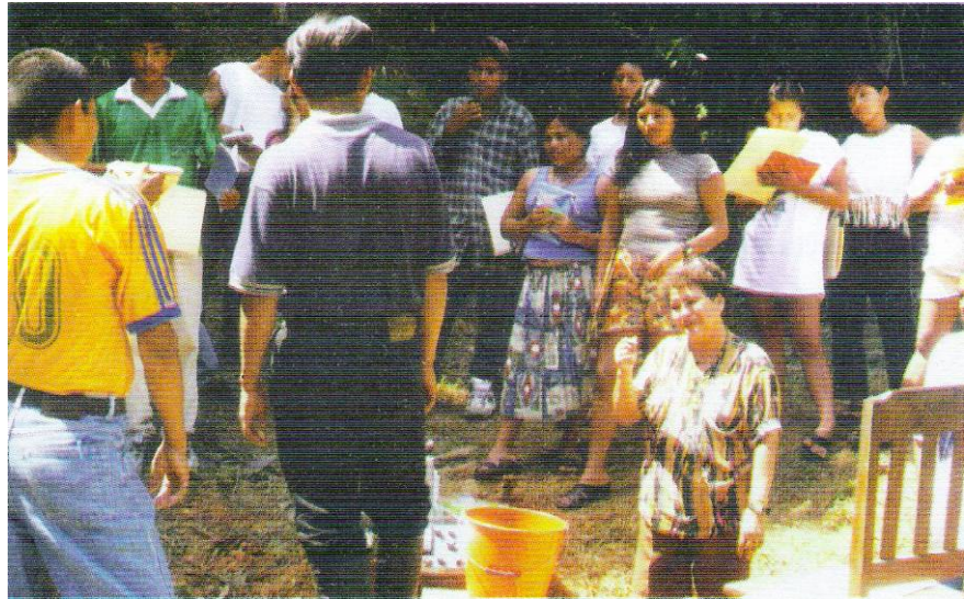
Formación de estudiantes