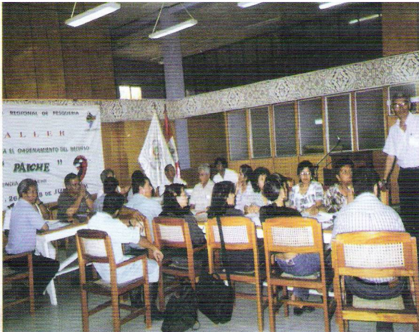
Reunión de coordinación