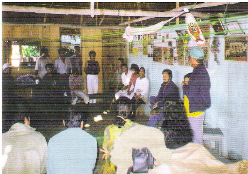
Asamblea de Beneficiarios en la Zona del río Tigre