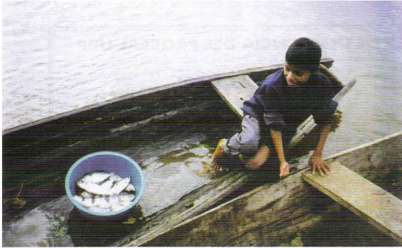
Principal actividad de las comunidades de la Carretera del Eje Iquitos-Nauta.