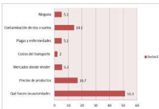
Gráfico 2: Información que demanda la Población de la zona MAP - Madre de Dios

Otro indicador importante en este análisis es, en el caso del Napo, se tiene que un 38% escucha radio y un 33% ve televisión, muy similar a Madre de Dios y el 78.3% de la población no usa internet, en tanto que en Madre de Dios, este porcentaje llega a 73%. Este nivel de acceso parecer ser una constante en la cuenca amazónica.