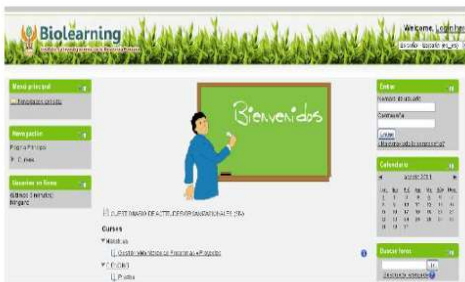
Plataforma BIOLEARNING, diseñada y desarrollada por el programa BIOINFO para uso de la comunidad educativa y académica de la Amazonía peruana.