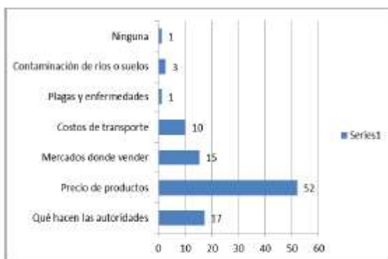
Gráfico 1: Información que demanda la población de la cuenca del NAPO - Loreto

Los primeros resultados, orientados a la oferta y demanda de información, nos indican que la población ribereña de Loreto tiene preferencia a conocer el precio de productos de la biodiversidad y productos urbanos que les permita mejorar sus transacciones con los intermediarios, en tanto que la población en Madre de Dios, prefiere información relativa a la gestión de sus autoridades locales para conocer campañas sobre actividades informales (ver gráficos 1 y 2)