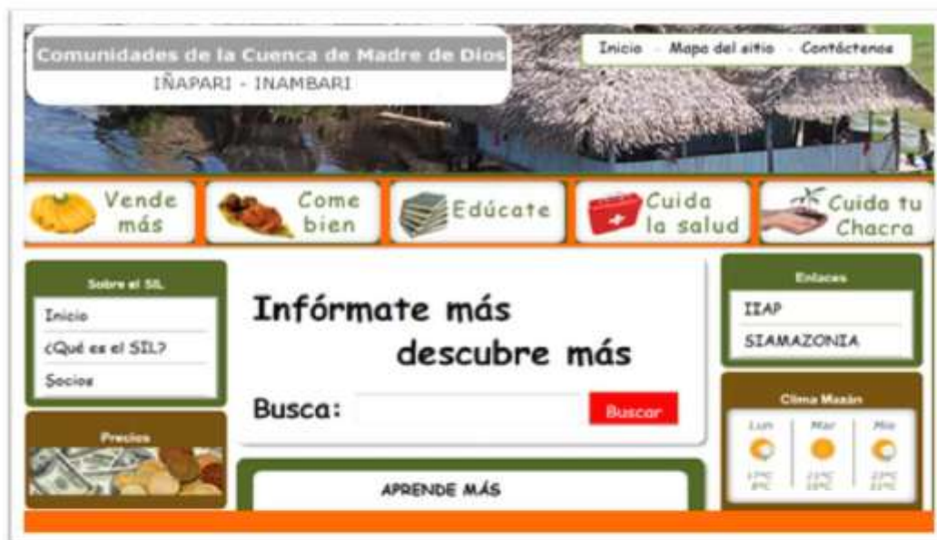
Vista de la interfaz principal del Sistema de Información Local Madre de Dios - SIL Madre de Dios.