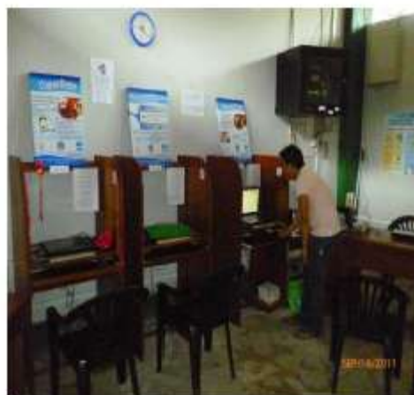
Las TIC son las herramientas claves para el desarrollo de los SIL en la cuenca del Napo.

Hasta el momento, se han iniciado la implementación de 04 SIL, dos en la cuenca del Napo donde se ha considerado las localidades de Santa Clotilde y Mazán, extendiéndose a otras comunidades que necesiten desarrollar la experiencia; y dos en Madre de Dios donde se ha considerado los distritos de Iberia e Iñapari.