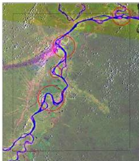
Áreas sensibles a la erosión y sedimentación

bordea los 3100 metros en promedio (1973-2010) presentándose el mayor desplazamiento en la zona de Iquitos con una media aproximada de 4 750 m.