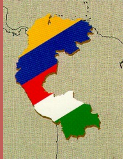
Comunidad Andina de Naciones CAN