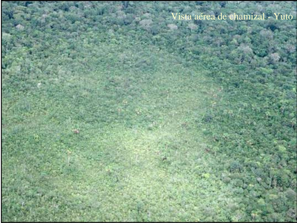
Vista aérea de chamizal - Yuto