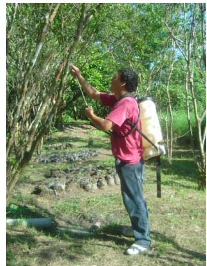
Control de Timocrática albella con barbasco a la concentración de 1:3.

En el presente año se realizó la evaluación de plagas del camu camu, y aguaje en parcelas cultivadas y experimentales de las Regiones Loreto y Ucayali. Fue identificado y caracterizado el “escarabajo de las raíces” Cyclocephala sp. (Coleoptera: Dynastidae), nueva plaga del camu camu; en el estado de larva se alimenta de las raíces de las plantas, lo cual provoca la muerte en viveros y en parcelas recién establecidas. Se identificó y caracterizó al “escarabajo” Strategus surinamensis (Coleoptera: Dynastidae), plaga del aguaje; en el estado adulto se alimenta de las raíces y del plato radicular de la palmera, y esto provoca la muerte de las plantas jóvenes. Se cuantificaron los daños ocasionados por Timocrática albella , plaga potencial del camu camu en las plantaciones de San Miguel. Las parcelas evaluadas presentaron una intensidad de ataque de 73.8 % y una incidencia promedio de 7.2 larvas/planta.