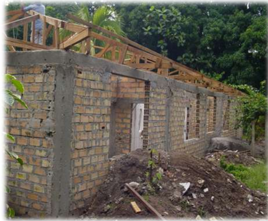
El laboratorio en febrero 2006