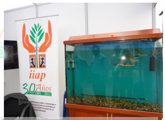
Acuario con exhibición de los seis paiches.

El sexado de Paiche es una tecnología que ha desarrollado el IIAP en alianza con el IRD y se está aplicando a esta especie que no tiene dimorfismo sexual, es decir a simple vista no se puede diferenciar la hembra del macho, esto dificulta unir certeramente un macho y una hembra para su reproducción, mediante la aplicación de kit de sexaje del paiche que consiste en una prueba sencilla de sangre para determinar el sexo. Este kit ya se encuentra a la venta a nivel mundial a un costo accesible, lo que está haciendo más fácil la producción de esta especie tan importante para el trabajo de los productores paichicultores.