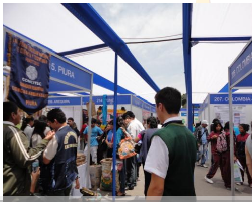
Interior de la Feria

Dentro de las actividades llevadas a cabo durante La Semana de Ciencia, Tecnología e Innovación se desarrolló el Encuentro Nacional de Consejos Regionales de Ciencia, Tecnología e Innovación y el Taller Internacional para formadores de educación , entre otras actividades.