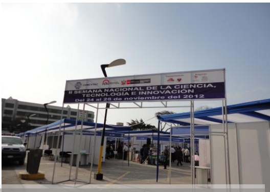
Entrada hacia la Semana Nacional de la Ciencia, Tecnología e Innovación

Del 24 al 27 de noviembre se realizó la Semana Nacional de la Ciencia, Tecnología e Innovación 2012 , organizada por el Consejo Nacional de Ciencia, Tecnología e Innovación (CONCYTEC) aquí se presentaron los prototipos e innovaciones a nivel escolar, universitario, institucional y empresarial del Perú y el Mundo, este importante evento se realizó en el Parque de la Exposición de la Ciudad de Lima.