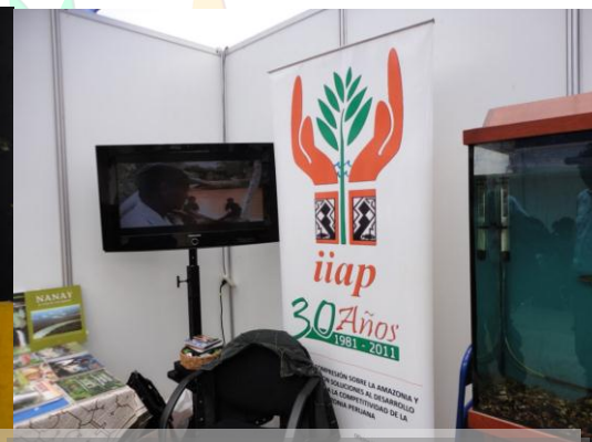
Stand del IIAP, proyectando videos institucionales