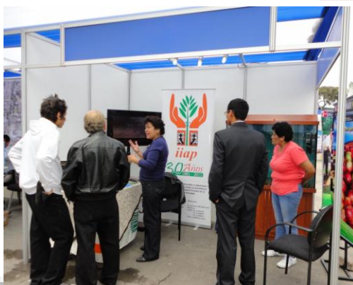
Stand del IIAP, exponiendo los avances en investigación a los interesados