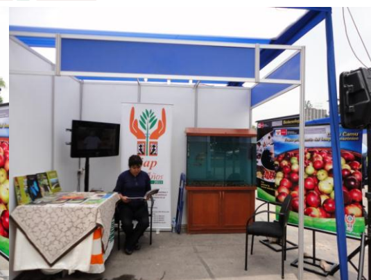
Stand del IIAP