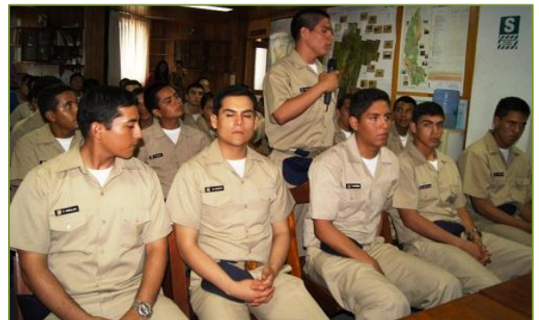
Cadetes de MGP consultando sobre el trabajo que realiza el IIAP.