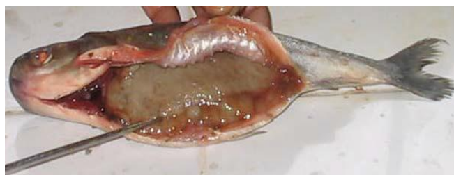
Ovario de llambina en estadio IV de maduración