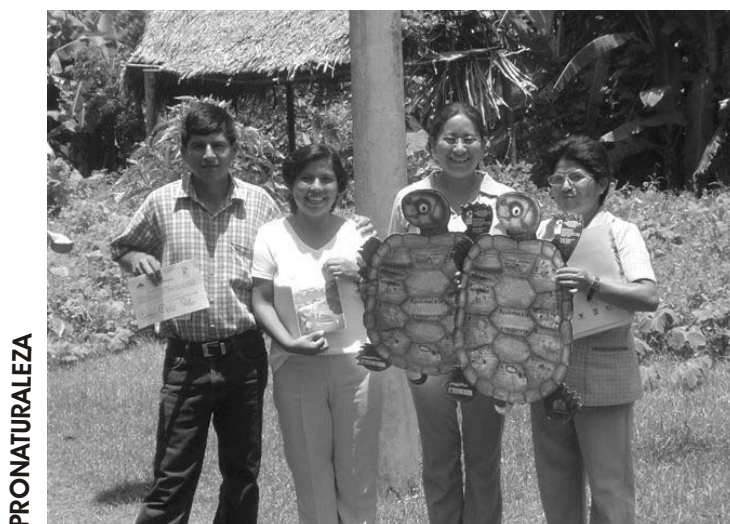
Fuente: Fichas de manejo de taricaya, PNE, ProNaturaleza, 2002 - 2006