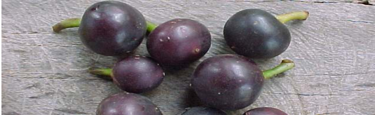
Tabla 3: Datos promedios de las principales características morfo agronómicas de 15 poblaciones de Pourouma cecropiifolia