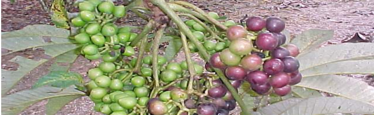
Tabla 1: Ficha de evaluación biométrica de frutos y semillas en uvilla Pourouma cecropiifolia .