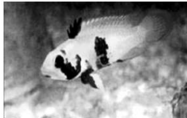
Figura 2. Ejemplar hembra adulta de A. panduro