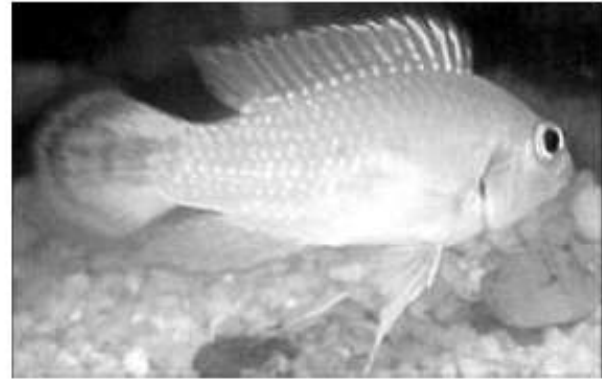
Figura 1. Ejemplar macho adulto de A. panduro

Se pudo constatar que los ejemplares cultivados alcanzaron rápidamente su mejor estado fisiológico pues iniciaron su actividad reproductiva a las dos